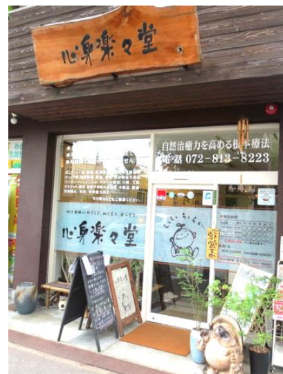
たぬきの置物が目印です